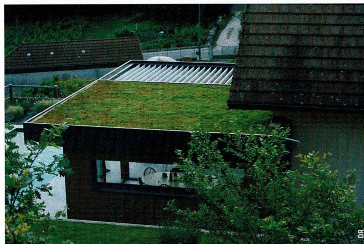
Ci-dessus : une autre extension signée Oléa du côté de Yenne cette fois.