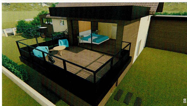
L'extension d'une maison classique (bien) vue par Oléa, à Reignier-Esery, Haute-Savoie.