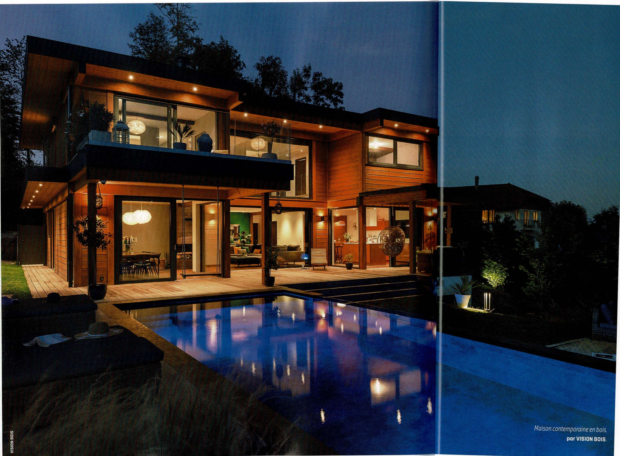
Maison contemporaine en bois. par VISION BOIS.