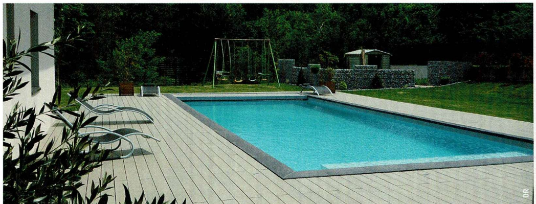
Projet signé Berger Jardins.

Pierre, verre et bois : un trio qui marche bien dans notre région !