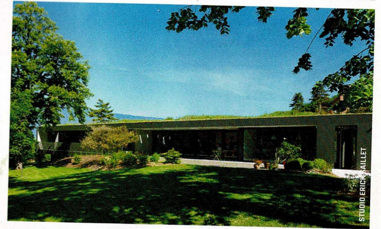
A Chambéry, le plain-pied dans sa plus simple expression... PAR PATEY ARCHITECTE.